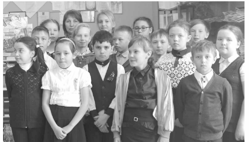
В районной библиотеке. Челно-Вершины